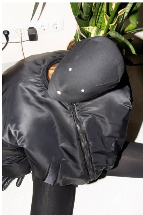
1 pav. a - Kolekcijos meninis kolažas, Ugnė Pienė Noreikytė, 2024; b - Kolekcijos spalvinė gama, Ugnė Pienė Noreikytė, 2024