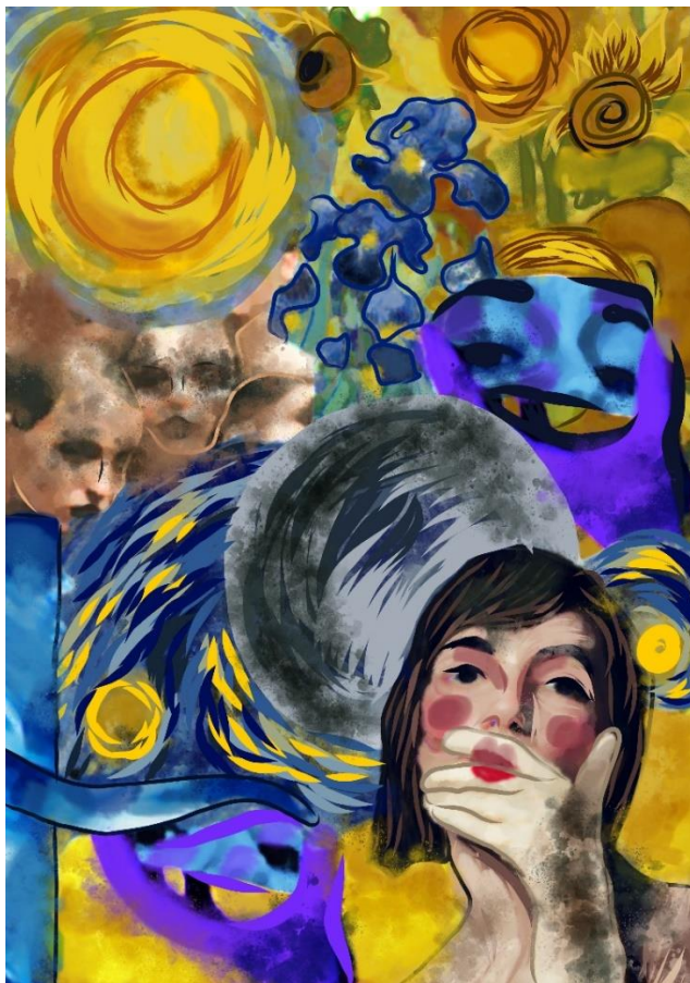
1 pav. Įvaizdinės fotosesijos meninis kolažas, aut. Erika Liubertaitė, 2024