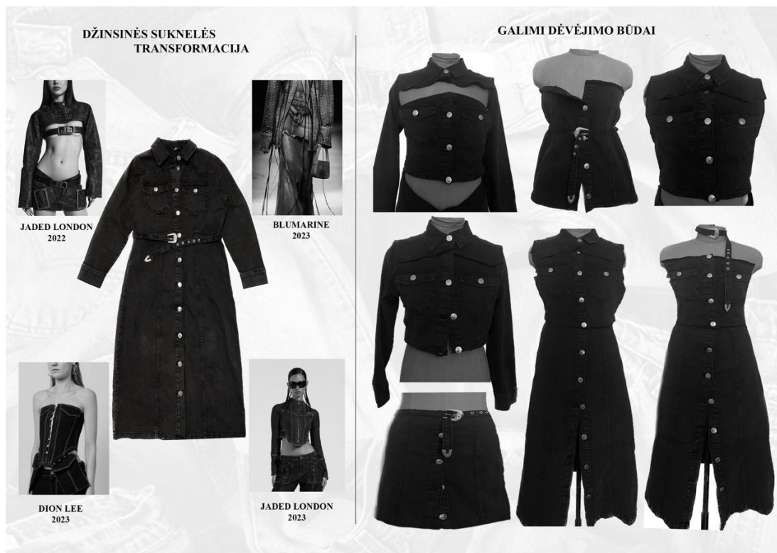
2 pav. Džinsinės suknelės transformacijos, aut. Karolina Ketvirytė, 2023