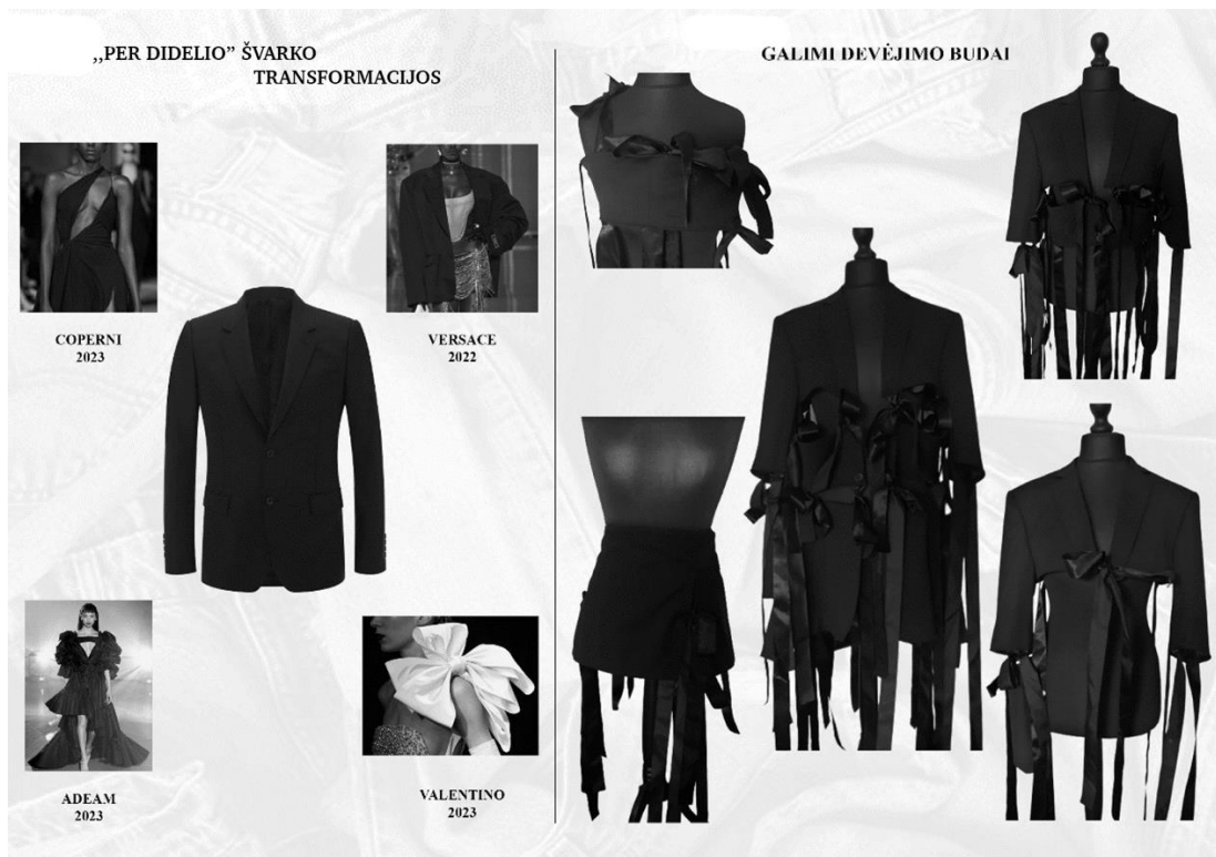
1 pav. Švarko transformacijos, aut. Mykolas Stasionis, 2023