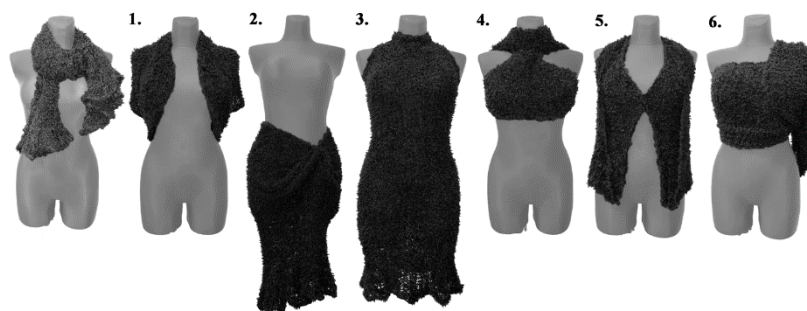
3 pav. Šaliko pritaikymas, aut. Beatričė Šustavičiūtė, 2023