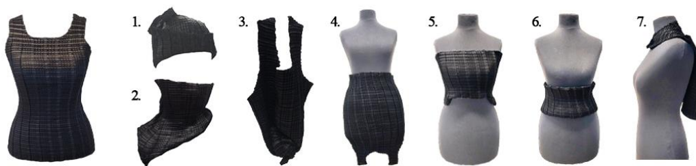
1 pav. Palaidinės pritaikymas, aut. Jonė Bieliūnaitė, 2023