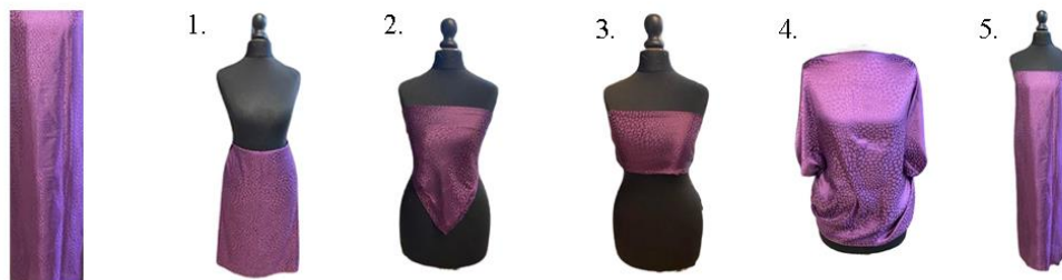
4 pav. Vienspalvės skaros pritaikymas, aut. Ksavera Balsytė, 2023