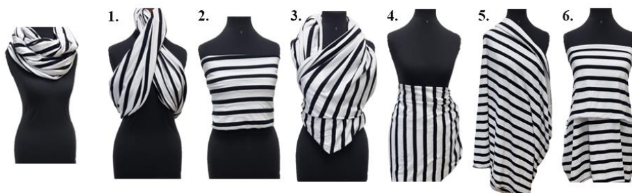
2 pav. Dryžuotos skaros pritaikymas, aut. Ernesta Zviedrytė, 2023