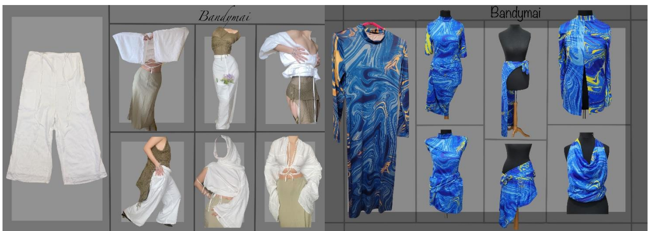
3 pav. Kombinezono transformacijos, aut. Kotryna Dirsytė, 2023 m.