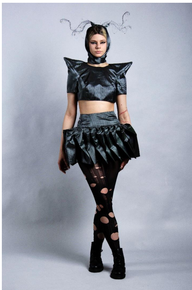
2 pav. Meninis dizaino modelis, sukurtas iš naudotų audinių. Aut. Karina Knyzaitė, 2023 m.