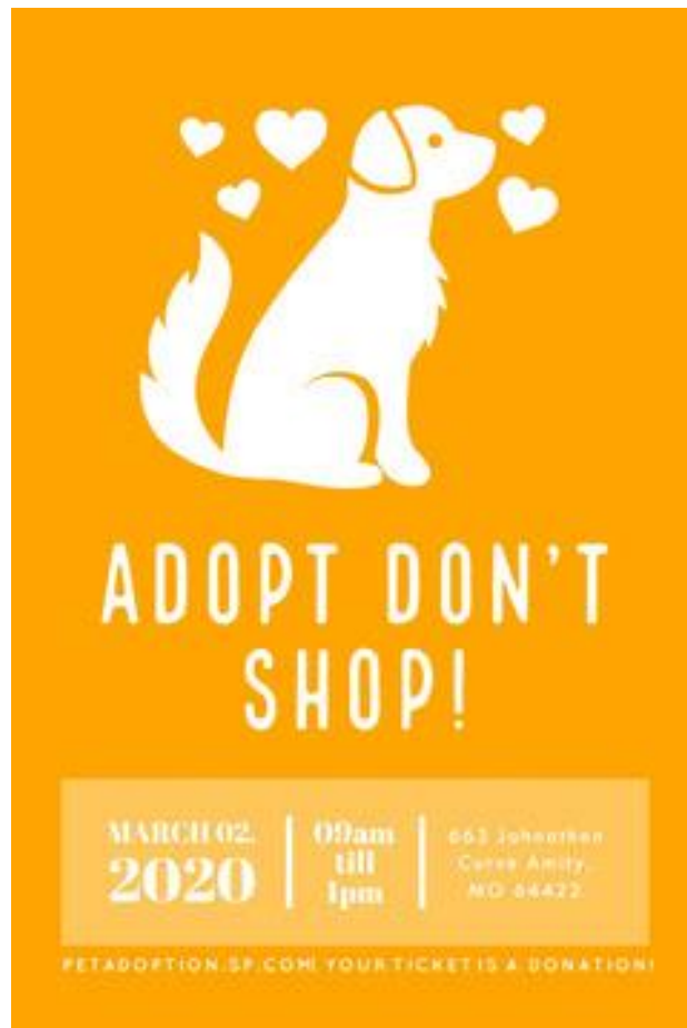
2 pav. Plakatas atitinkantis sėkmingumo kriterijus, 2020