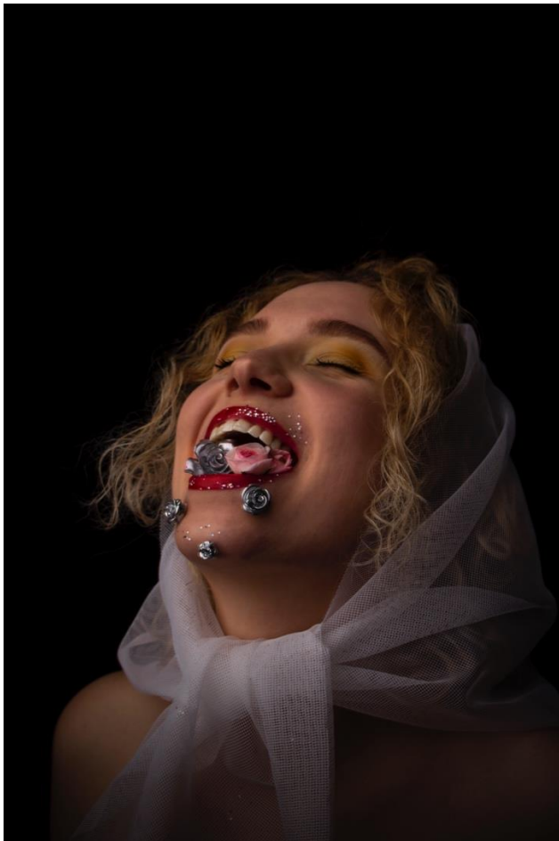
1 pav. Ekstazė, 2022 Aut. Karolina Vaitiekūnaitė Vizažo ir plaukų stilistė: Ugnė Andziulevičiūtė Asistentės: Samanta Lukauskaitė; Karolina Ketvirytė