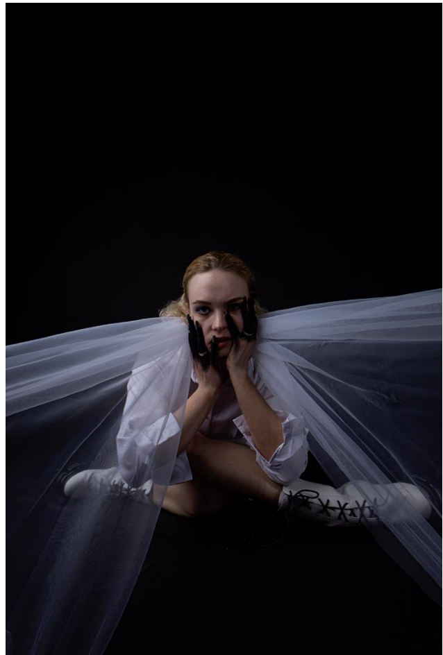
2 pav. Pavydas, 2022 Aut. Karolina Vaitiekūnaitė Vizažo ir plaukų stilistė: Ugnė Andziulevičiūtė Asistentės: Samanta Lukauskaitė; Karolina Ketvirytė