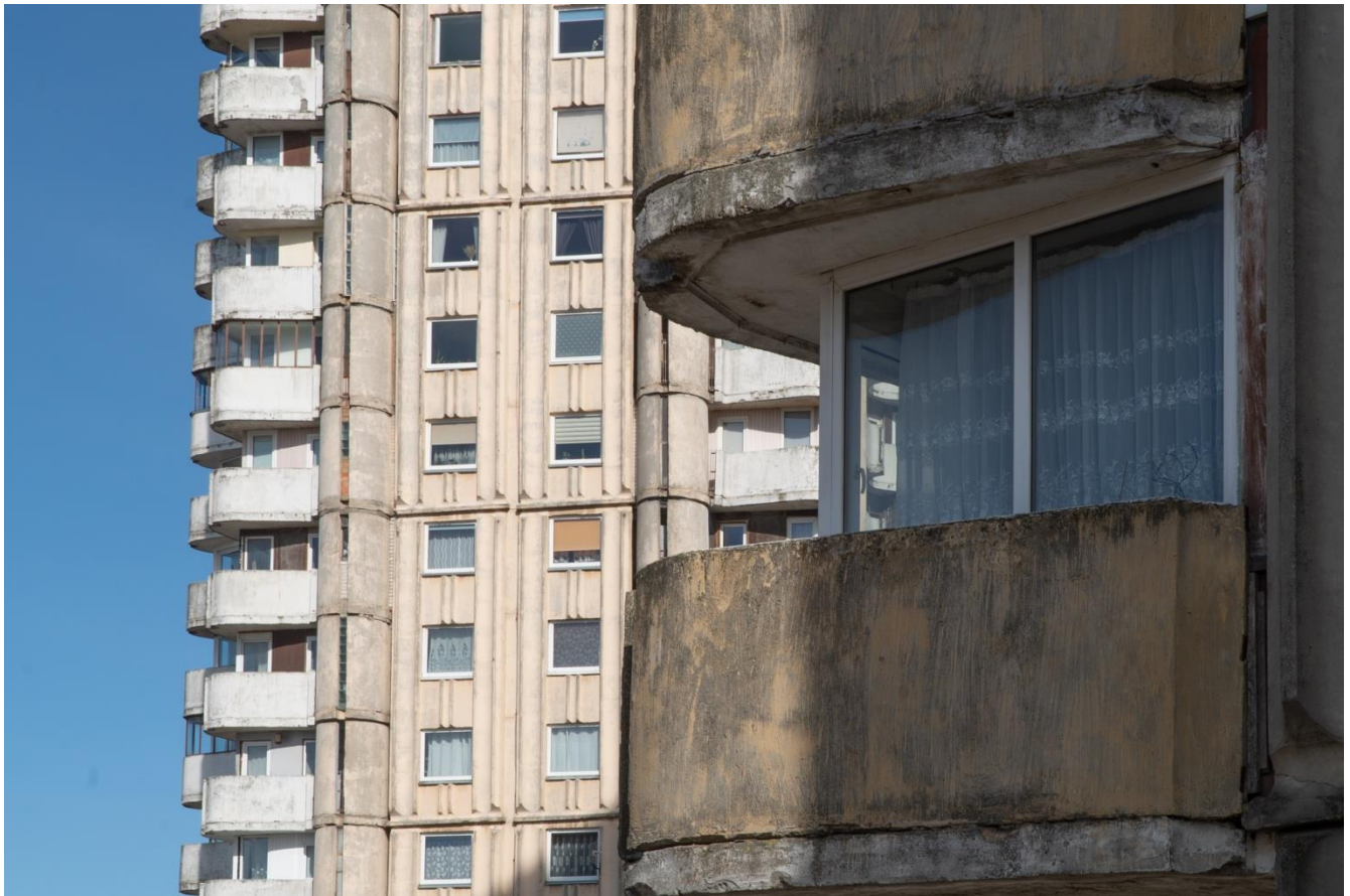
1 pav. Vizualioji tyrimo dalis Aut. Ieva Sutkaitytė, 2022