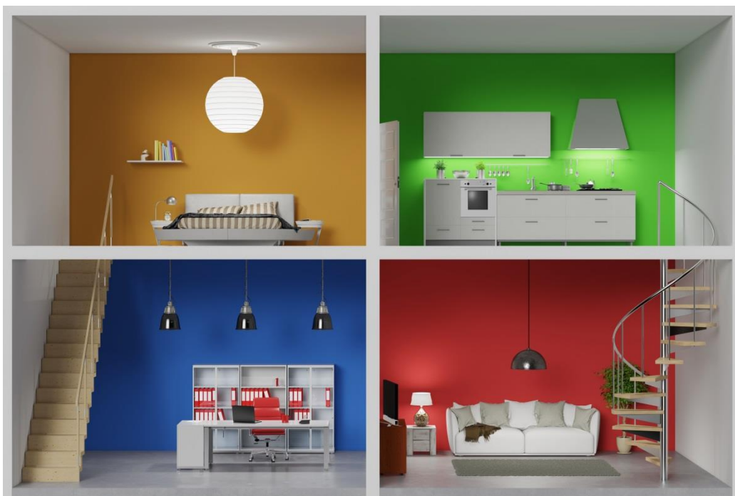
2 pav. Spalvų vaidmuo interjere. Aut. Robert Kneschke, 2019