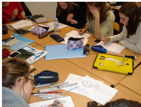
3 pav. Įsitraukimas į kūrybišką mokymo(si) procesą komandinėje aplinkoje (angl. Co-Design environment) lemia mokymo(si) sampratos, grįstos savarankiškėmis studijomis, kitokią raidą. Aut. Danielis Radzevičius, 2022