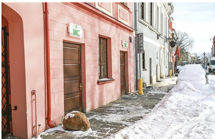
3 pav. Vienintelis Kauno mieste esantis viešasis tualetas „paslėptas“ Rotušės aikštėje.