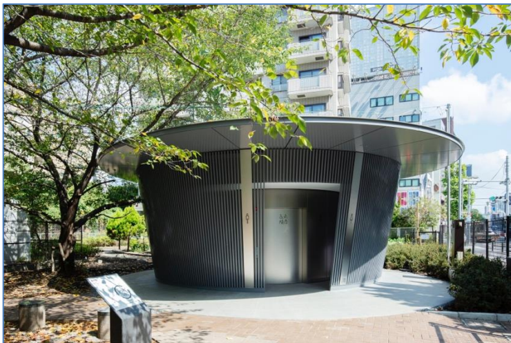
1 pav. Viešasis tualetas Japonijos sostinėje – Tokijuje, Šibujos rajone. Šaltinis: Satoši Nagare /floornature , 2021