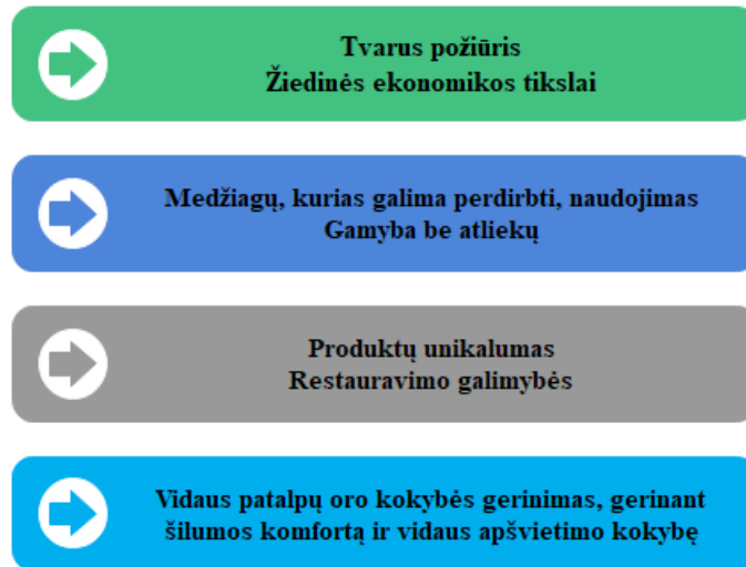
1 pav. Tvarumo principai interjero dizaine